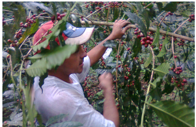
"Cultivadores de café, Veracruz, México". INECOL

y distribución del café en México, parametrizados con datos de censos nacionales y visitas de campo. Los escenarios representarán opciones de políticas que, de implementarse, alterarían el curso del sector cafetalero. La evidencia de las diferencias entre los escenarios, medidos en términos de impactos humanos, incluidos los servicios ecosistémicos, los desechos y las externalidades, se utilizará para desarrollar recomendaciones para políticas y programas nuevos o para mejorar los existentes que beneficiarían al sector cafetalero.