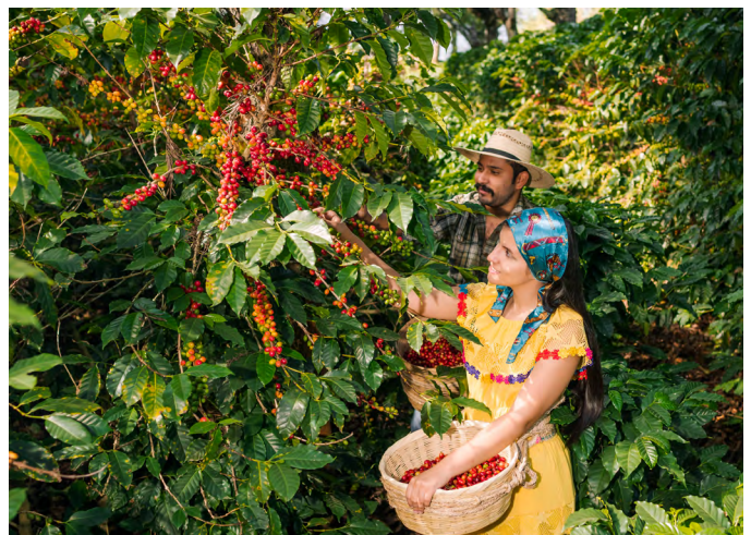
"Recolectores de café, Veracruz, México".