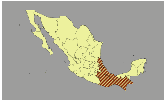
Mapa de la Iniciativa TEEBAgriFood para café en México

El estudio abarcará las 11 regiones cafetaleras de México, ubicadas en los principales estados cafetaleros: Chiapas, Oaxaca, Veracruz y Puebla.